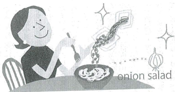
モズク酢納豆をサラダにかけるのが日課!

ほどありました。加えて仕事の関係で夜勤があり、夜中に食事をとることも少なくありません。そんななか、モズク酢納豆を食べ始めたところ、血圧が下がるとともに、食前血糖値も100mg/dlまで下がり、ヘモグロビンA1cも6%台まで下げることができました。さらに体重も70kgまで落ちました。その後、モズク酢が手に入らなくなったこともあって、当初ほどはきつちり続けているわけではありませんが、なるべく納豆を食べるように心がけています。モズク酢がなければ、納豆に酢